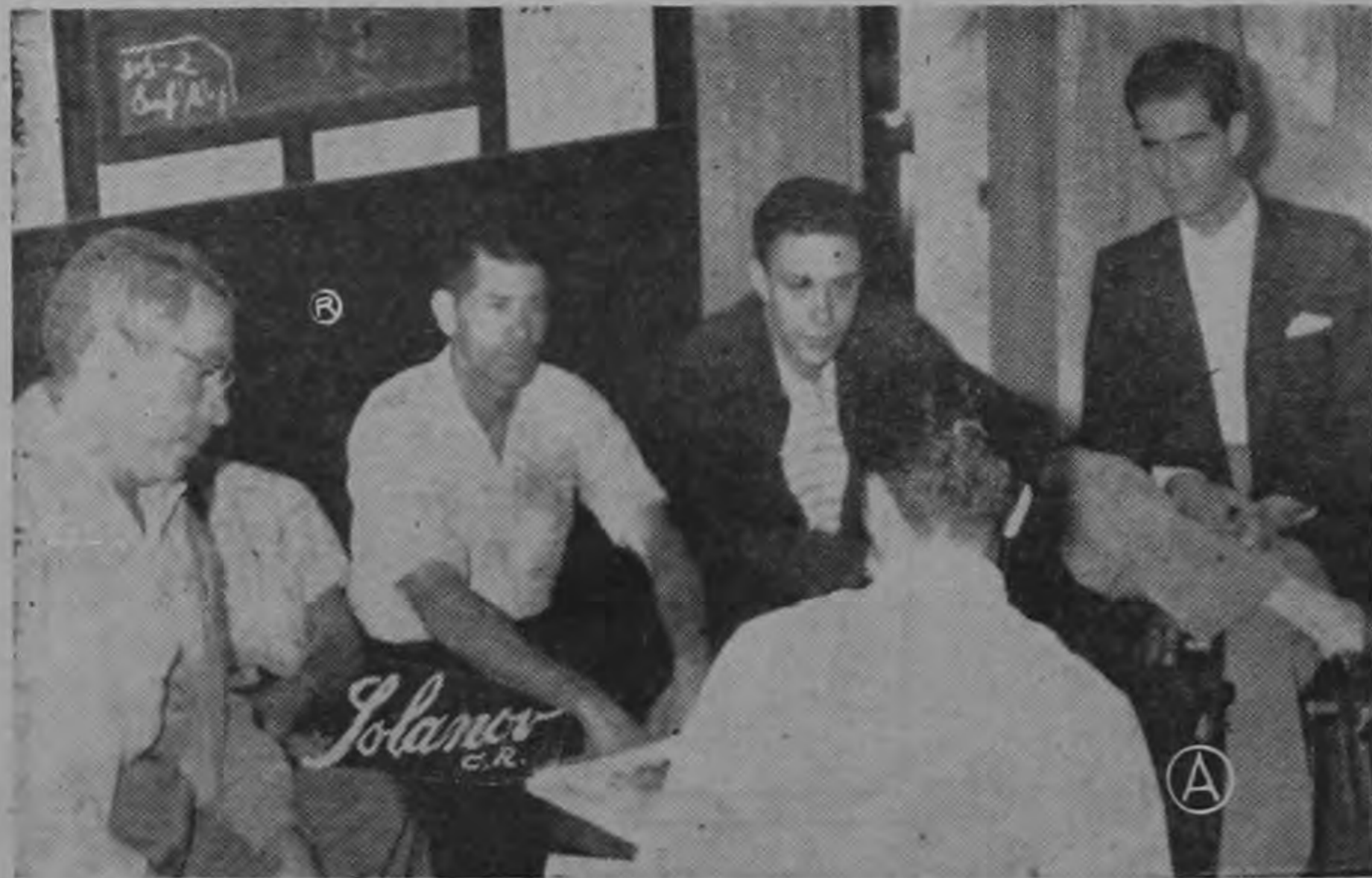
CINCO TRABAJADORES que representan a centenares que el gobierno actual destituyó ilegalmente pues hasta la fecha a ninguno le han sido pagadas sus prestaciones legales, a pesar de que la mayoría tienen dos y más años de haber sido separados de sus cargos injustamente.

Conocemos también que el régimen de admisiones en el partido también es más estricto y ha disminuido considerablemente. Insistimos en afirmar que la Unión Soviética enfrenta problemas muy graves y de difícil solución.