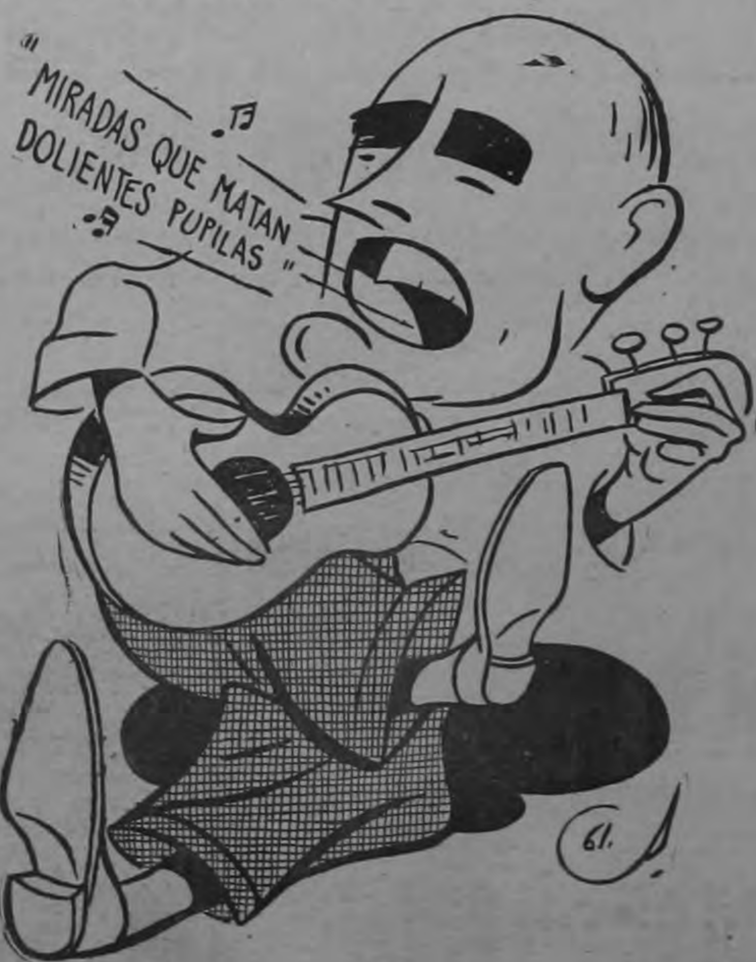
la del "cisne" que canta cuando se está muriendo...