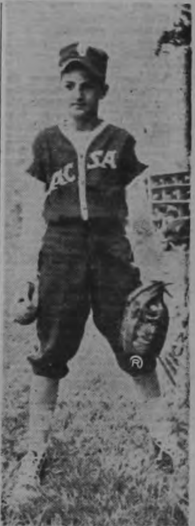
Con más bien una sentencia, terminó nuestra charla con otro de los ases del mañana.